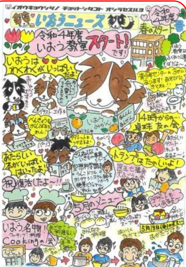
「いおうニュース」作：担当 吉田 SSW

「いおう教室」は、福光公園そばの青少年センターの3階にあります。学期途中の入退級も可能です。一人一人に応じた過ごし方ができるよう指導員が相談に応じます。まずは、見学したり、お試し入級したりしてみませんか。学校やいおう教室に気軽にお問い合わせください。